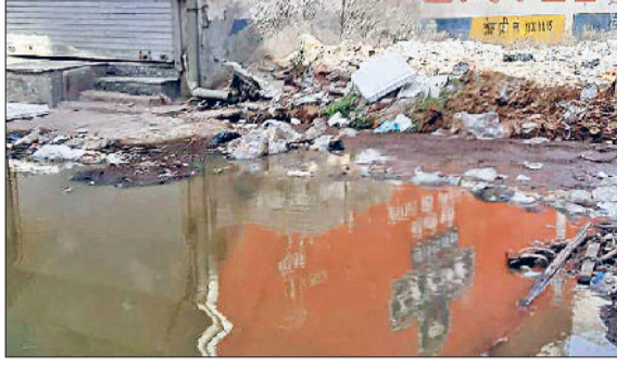
रोहतक। माल गोदाम रोड पर भरा गंदा पानी व गोबर।