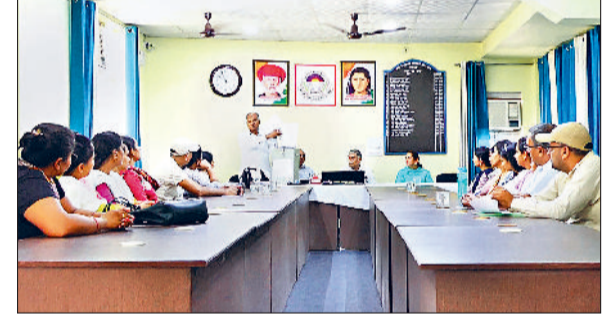
रोहतक। मीटिंग को सम्बोधित करते हुए चुनाव अधिकारी।