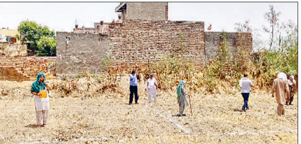
रोहतक। गांव भैयापुर के गरीब परिवारों को प्लॉट का कब्जा देते हुए अधिकारी

जिला प्रशासन द्वारा महात्मा गांधी ग्रामीण बस्ती योजना के तहत आज ग्राम पंचायत भैयापुर के 12 लाभार्थियों को 100-100 गज के प्लॉट का मालिकाना हक व कब्जा प्रदान किया गया। उपायुक्त अजय कुमार ने बताया कि वर्ष 2008 में हरियाणा सरकार द्वारा घोषित महात्मा गांधी ग्रामीण बस्ती योजना के तहत जिन लाभार्थियों को जिनका नाम 2008 की लाभार्थियों की सूची में था और उन्हें किसी कारणवश अब तक कब्जा नहीं मिला था, उन्हें कब्जा देने